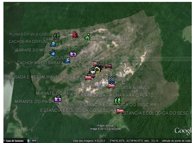
2. Ilustração do Sistema desenvolvido – Plataforma da Google Maps.