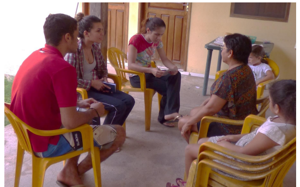
3. Aplicação de entrevistas com a comunidade na Serra do Tepequém.