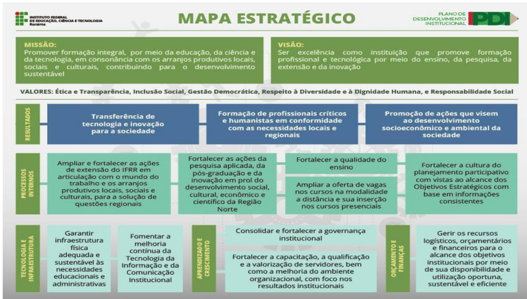
Figura 1 - Mapa Estratégico IFRR (2019-2023)

Fonte: Plano de Desenvolvimento Institucional – 2019-2023